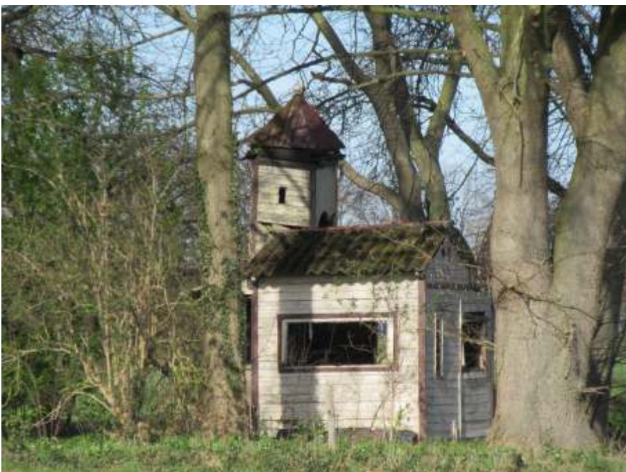
Klein maar fijn

Nee, ik had alleen de kerstnacht en de kerstmorgen als extra drukte. En daarin kwamen alle doelgroepen samen. De kerstnachtviering werd ondersteund door een gelegenhedscantorij van eigen gemeenteleden en dito orkest. Lectoren, zangers en muzikanten uit alle leeftijdscategorieën waren betrokken. Weliswaar bij elkaar nog geen twintig maar wel een evenredige vertegenwoordiging. En ook op kerstmorgen was een deel van hen weer betrokken.